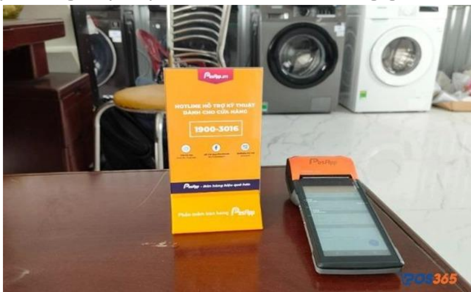
Phần mềm PosApp