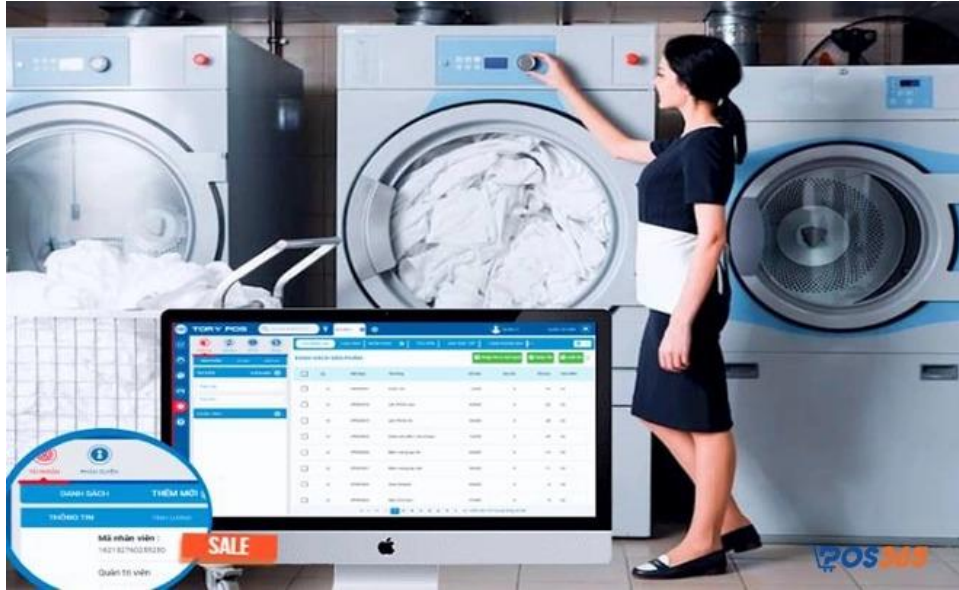
Phần mềm tonyssoft